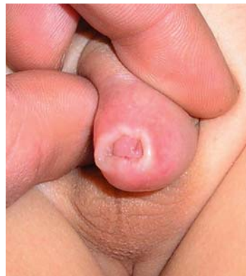
Abbildung 1: Typische weißlich narbige Phimose bei Lichen sclerosus

Häufig entwickelt sich binnen vier Monaten postoperativ eine leichte Meatusstenose. In 10,7 % der wegen Lichen beschnittenen Jungen kam es bei den eigenen Patienten zu einer funktionell relevanten Meatusstenose ( Abbildung 3 ). Bale et al. berichteten über einen ähnlichen Anteil an postoperativen Meatusstenosen (5), die als spezifische Folge der Erkrankung gewertet wurden (e4), wohingegen Kiss diese Beobachtung bei 471 LS-Patienten nicht machte (6).