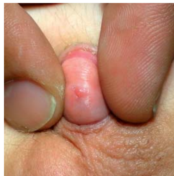
Abbildung 3: Meatusstenose 4 Monate nach Beschneidung wegen Lichen sclerosus

Bemerkenswert erscheint, dass sich die Meatusstenose noch nach einigen Jahren entwickeln kann, ohne dass eine Persistenz oder ein Rezidiv des Lichen sclerosus nachweisbar wäre (e5). Eine Erklärung könnte in der Mangel durchblutung des Meatus nach Sklerosierung der Frenulumregion liegen (e6).