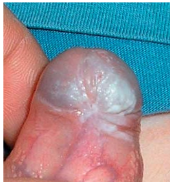
Abbildung 2: Bei noch reponibler Vorhaut ist der perifrenuläre Befall mit Frenulum breve deutlich zu erkennen.